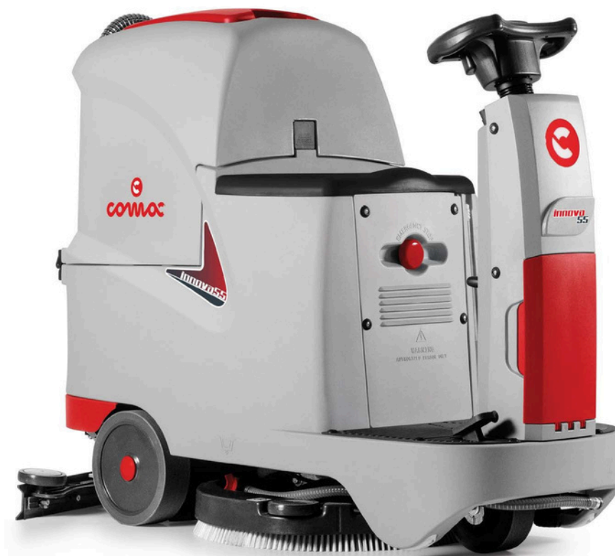
INNOVA 55 Verzija sa disk četkom