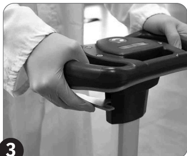
3 Podesite upravljač