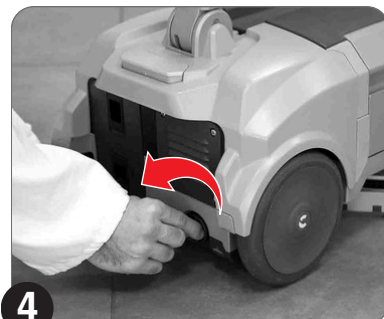
4 Spustite usisnu papuču