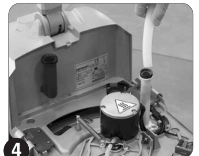
4 Očistite usisno crevo