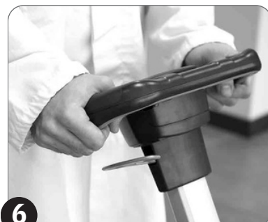
6 Pritisnite taster za četku/usisavanje