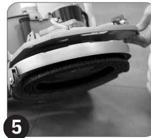
5 Proverite istrošenost četke ili nosača filca (uraditi to bez postavljenih rezervoara)