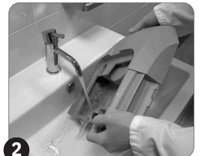
2 Očistite rezervoar za prljavu tečnost