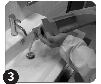
3 Ispraznite rezervoar za prljavu tečnost