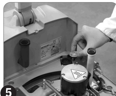
5 Očistite filter čiste vode

PAŽNJA: Sve operacije održavanja moraju se obavljati bez postavljenih rezervoara na mašini