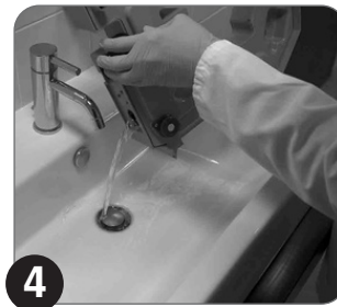
4 Ispraznite rezervoar za čistu tečnost