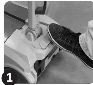
1 Isključite mašinu