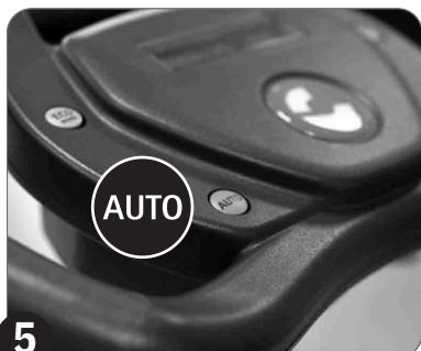
5 Pritisnite taster AUTO