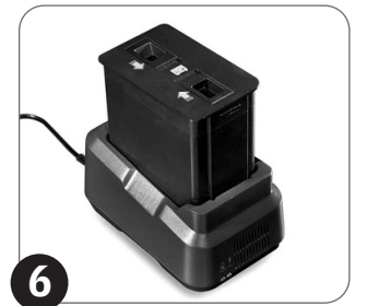
6 Ako je nivo napunjenosti baterije nizak, stavite mašinu na punjenje