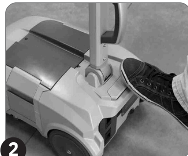
2 Uključite mašinu